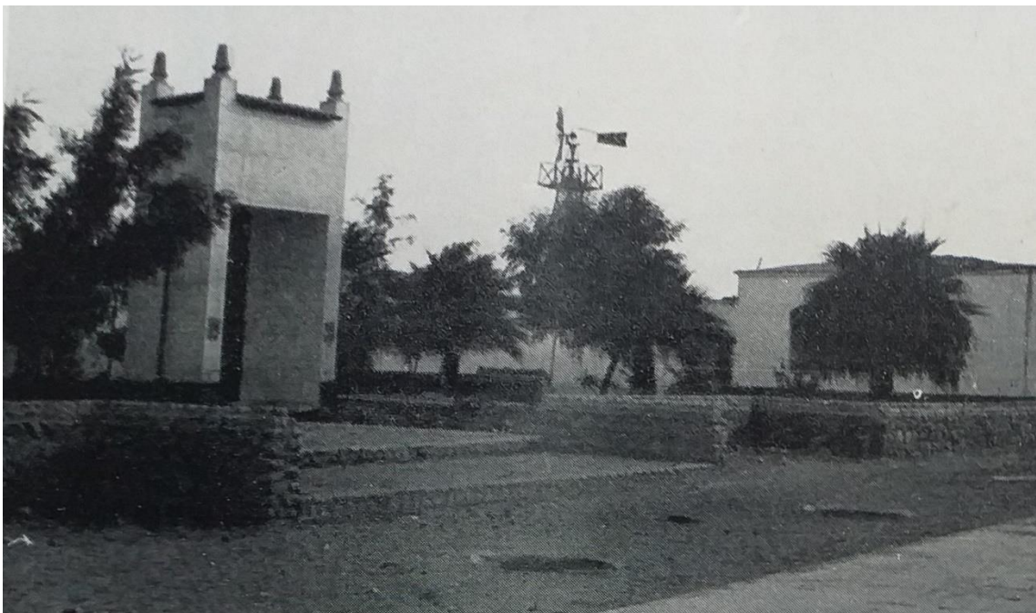
Fig. 2. Plazuela ubicada en la esquina José Gálvez-Elías Aguirre, frente a la antigua estación del ferrocarril en Moche