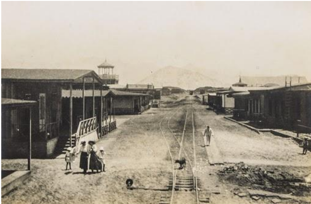
Fig. 6. Antigua estación el ferrocarril en Moche