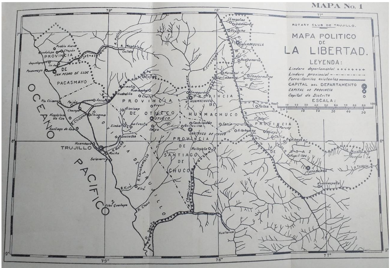
Fig. 8. Ubicación del ferrocarril Salaverry-Trujillo hacia 1935