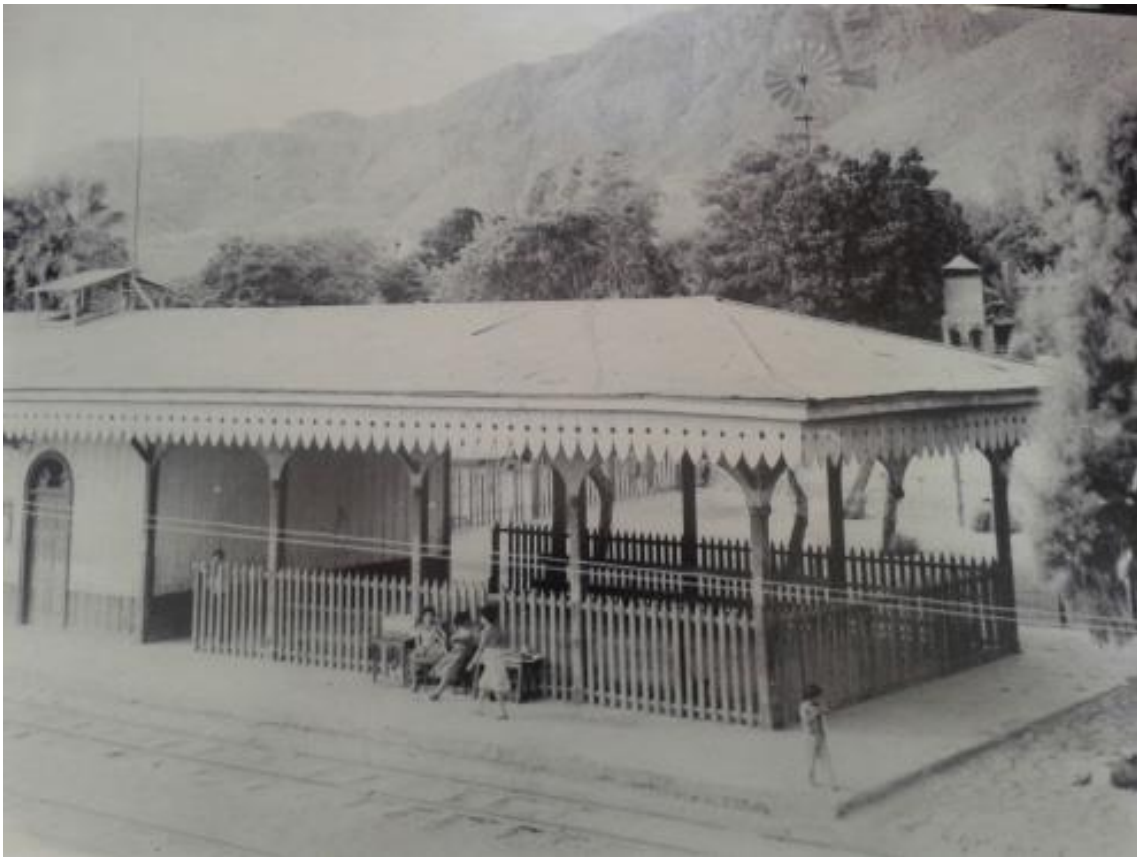
Fig. 1. Antigua estación del ferrocarril en Ascope (Calle Progreso, frente al mercado de abastos)