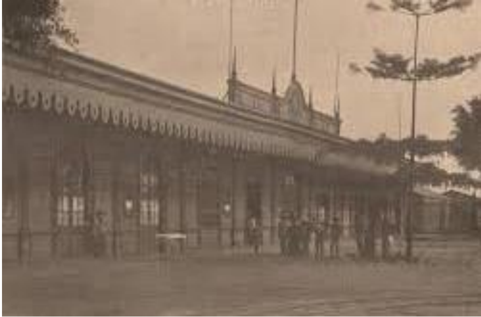
Fig. 10. Antigua estación del ferrocarril en Trujillo