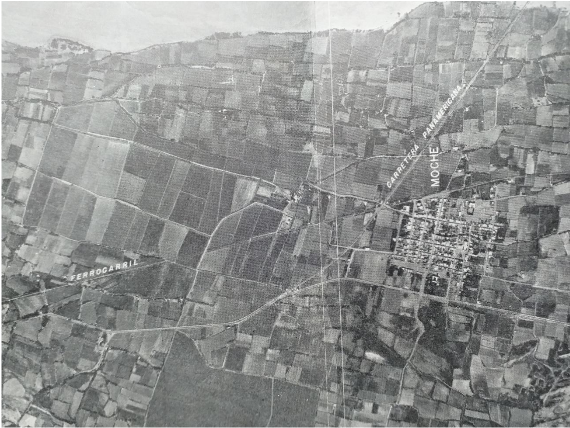
Fig. 12. Detalle de la figura 11.