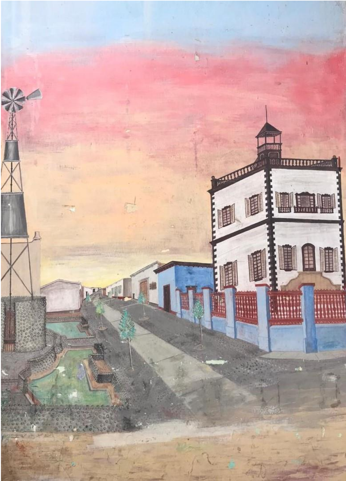
Fig. 3. Antigua estación del ferrocarril en Moche, frente a la “Plazuela de la Mariposa”. (Autor: Armando de la Rosa Cedeño)