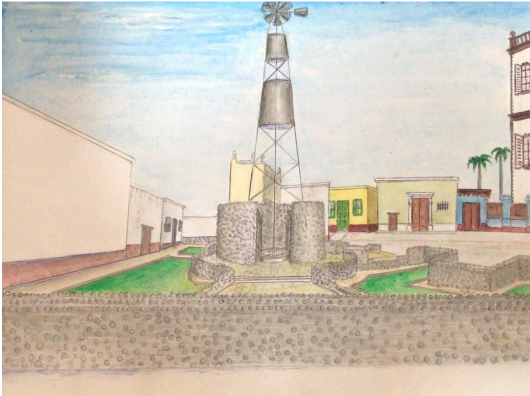
Fig. 4. Detalle de la “Plazuela de la Mariposa”, frente a la Antigua estación del ferrocarril en Moche (Autor: Armando de la Rosa Cedeño)