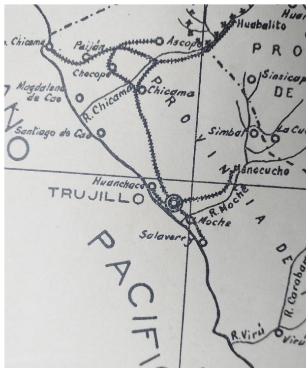
Fig. 9. Detalle de la figura 8