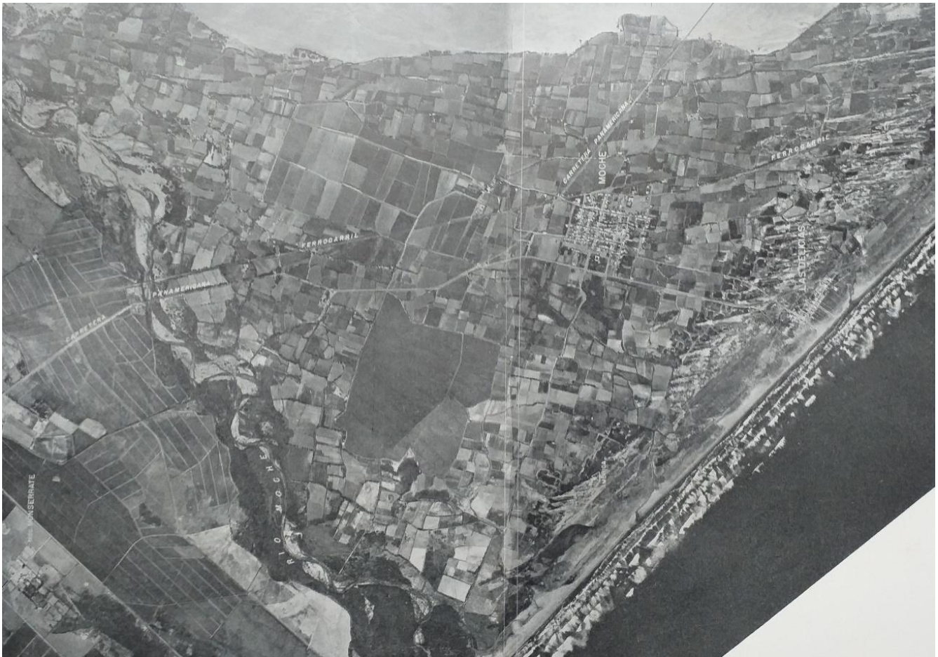
Fig. 11. Plano de la villa de Moche, hacia 1945. Incluye el trazo del ferrocarril Salaverry-Moche